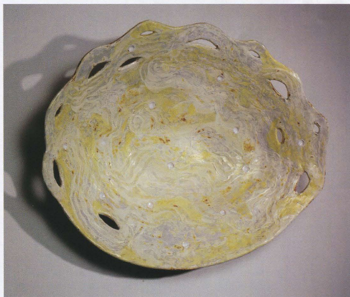
Ozon , keramisk fat i blåleire, 90 cm, Marit Tingleff, 1988.

I mitt arbeid har jeg alltid hatt den keramiske tradisjonen med som bagasje, den er full av skjønnhetsbegrep, vakre former, fantastiske glasurer, vidunderlig ornamentikk ... alt det er gjort – jeg kan ikke overgå det! Men jeg kan snakke med den historien, og vise andre sider av dette materialet.