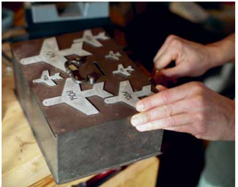
Den interaktive installasjonen Sverm kommer også med en enkel betalingsløsning, som Melland oppfordrer publikum til å benytte når de henter ned et fly fra veggen.