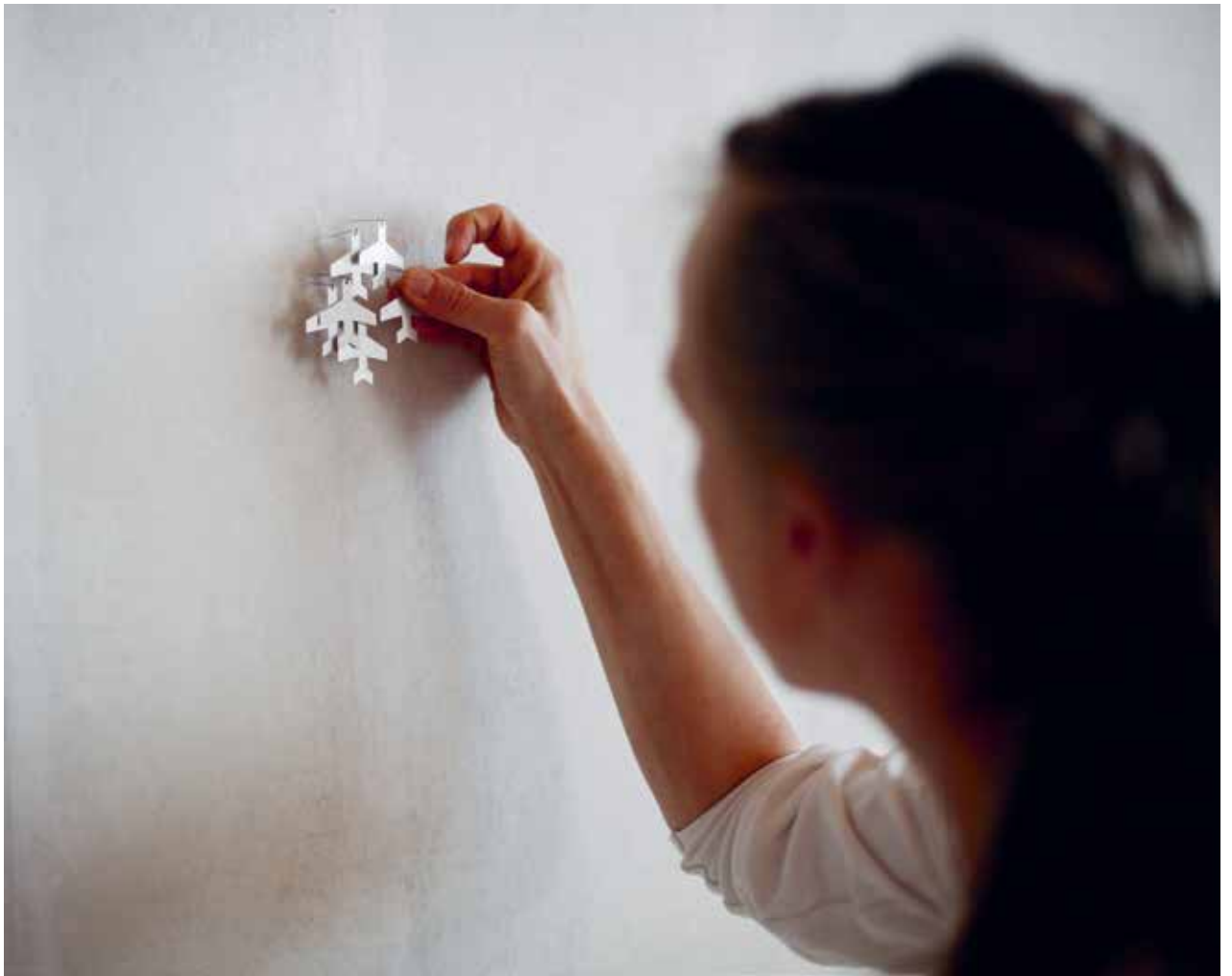
Nanna Melland, Sverm (installasjon, detalj), (2012), variabel størrelse, laserskåret aluminium, stålpins.