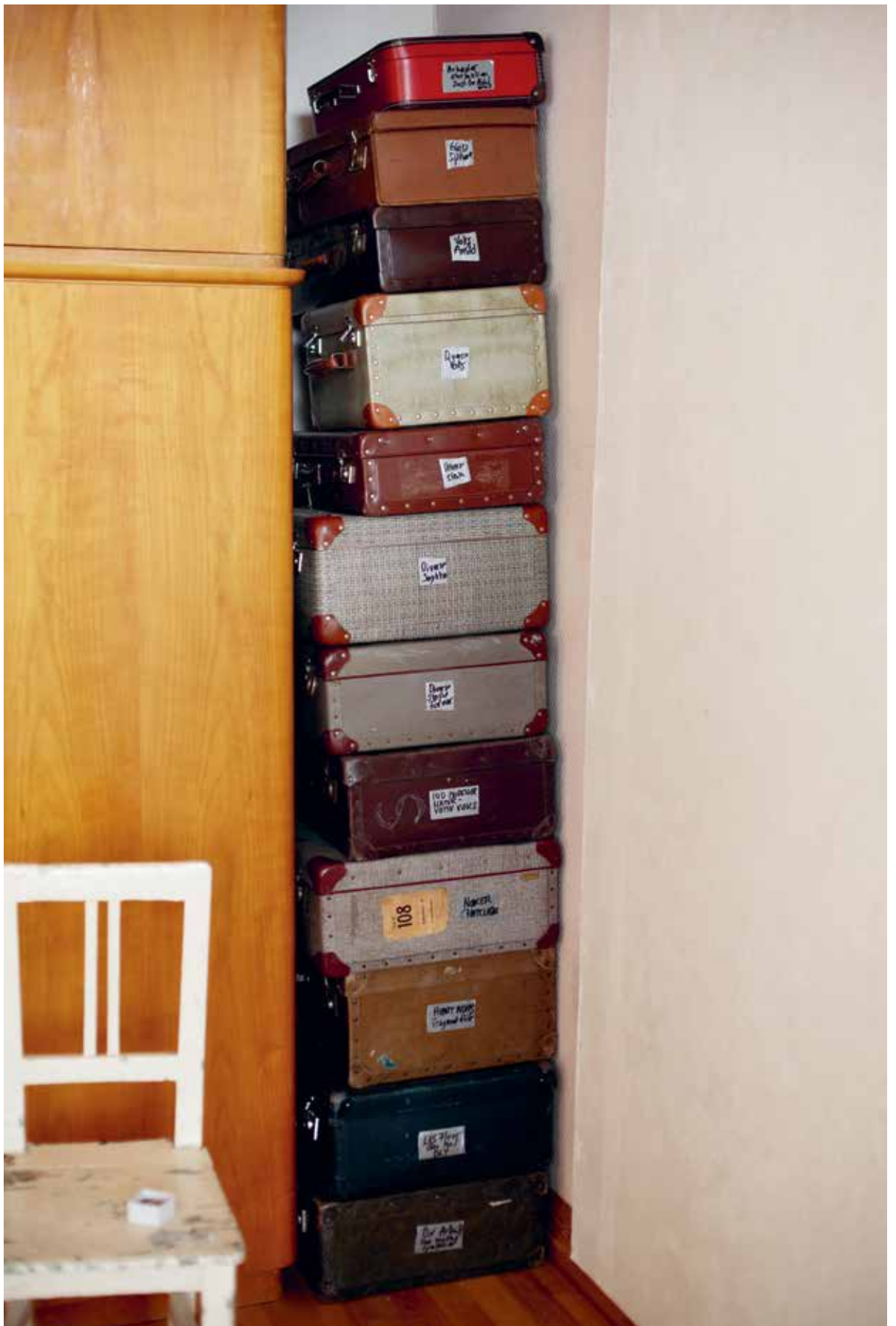
Eldre reisevesker med Mellands utstyrsarsenale, som krever større volumer enn de ortokse juvelerernes smykkeofferter kapasitet.