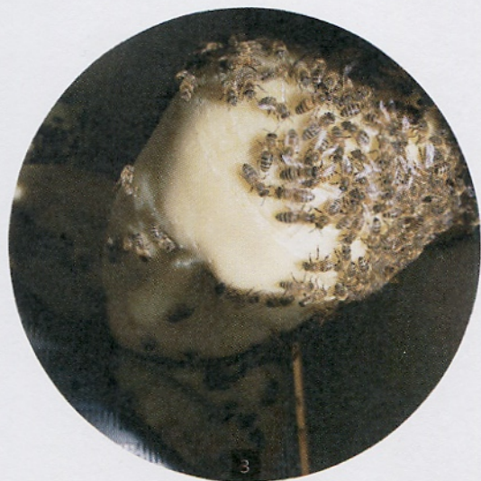
1 Frå utstillinga. 2 Skulpturen «Skrik». 3 60 000 bier har tatt bustad i skulpturane.